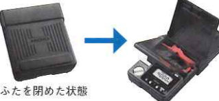
ふたを開めた状態