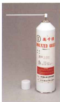
校正用CO/CO 2 ガスプッシュ缶 1508

*CMCD-200をお使いになる際は、ゼロ調整用ガスプッシュ缶No.1509、校正用CO/CO 2 ガスプッシュ缶No.1508、2LサンプリングバッグNo.1356も合わせてお買い求めください。